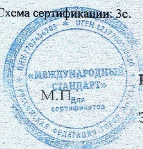
Схема сертификации: Зс.